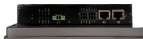
Vue bandeau connecteurs

Enfin, les performances sont 2 à 3 fois supérieures à la génération précédente (Pi 4), c'est plus de vitesse de calcul et plus de performance.