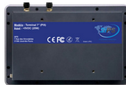
Vue face arrière avec VESA